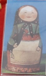
Так выглядели первые русские матрёшки.